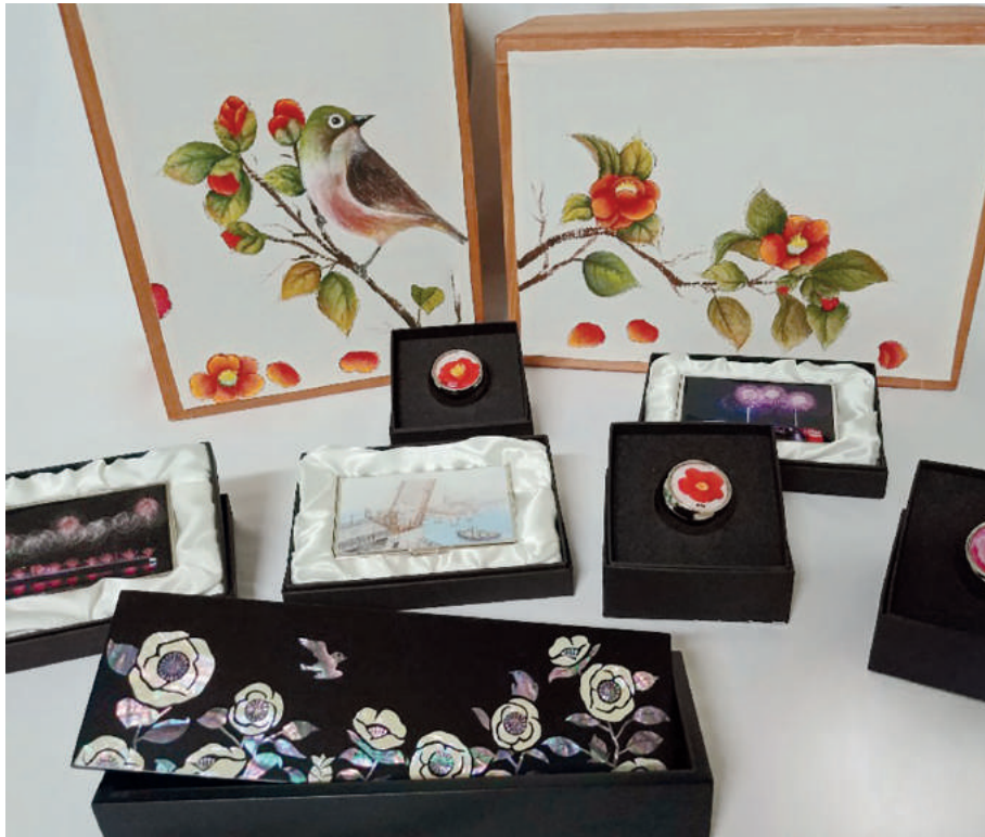
2019 부산 대표 관광기념품 10선