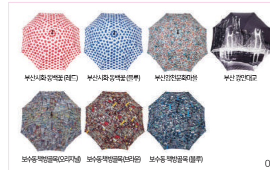
부산시화동백꽃(레드) 부산시화동백꽃(블루) 부산감천문화마을 부산광안대교