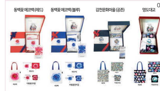
동백꽃 에코백(레드) 동백꽃 에코백(블루) 감천문화마을(공존) 영도대교