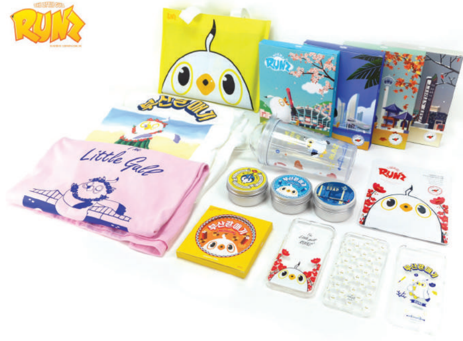
2019 부산 대표 관광기념품 10선