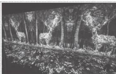
고정형 XR 체험관