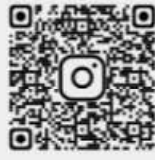
과정별 상세 안내