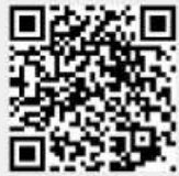
연간 교육 캘린더

이 외에도 다양한 온/오프라인 과정도 모집중이니, 아래 QR코드를 확인해주세요!