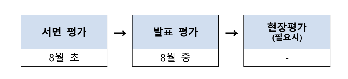
< 선정평가 프로세스 >