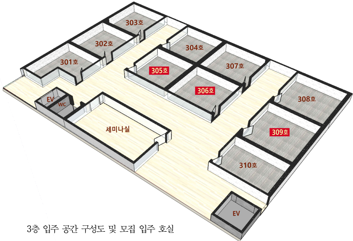
3층 입주 공간 구성도 및 모집 입주 호실

※ 공용공간 : 세미나실(15인수용, 빔프로젝트 구비) 3층 휴게공간 3, 4, 6층 무상 사용가능