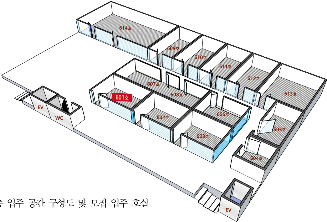
6층 입주 공간 구성도 및 모집 입주 호실