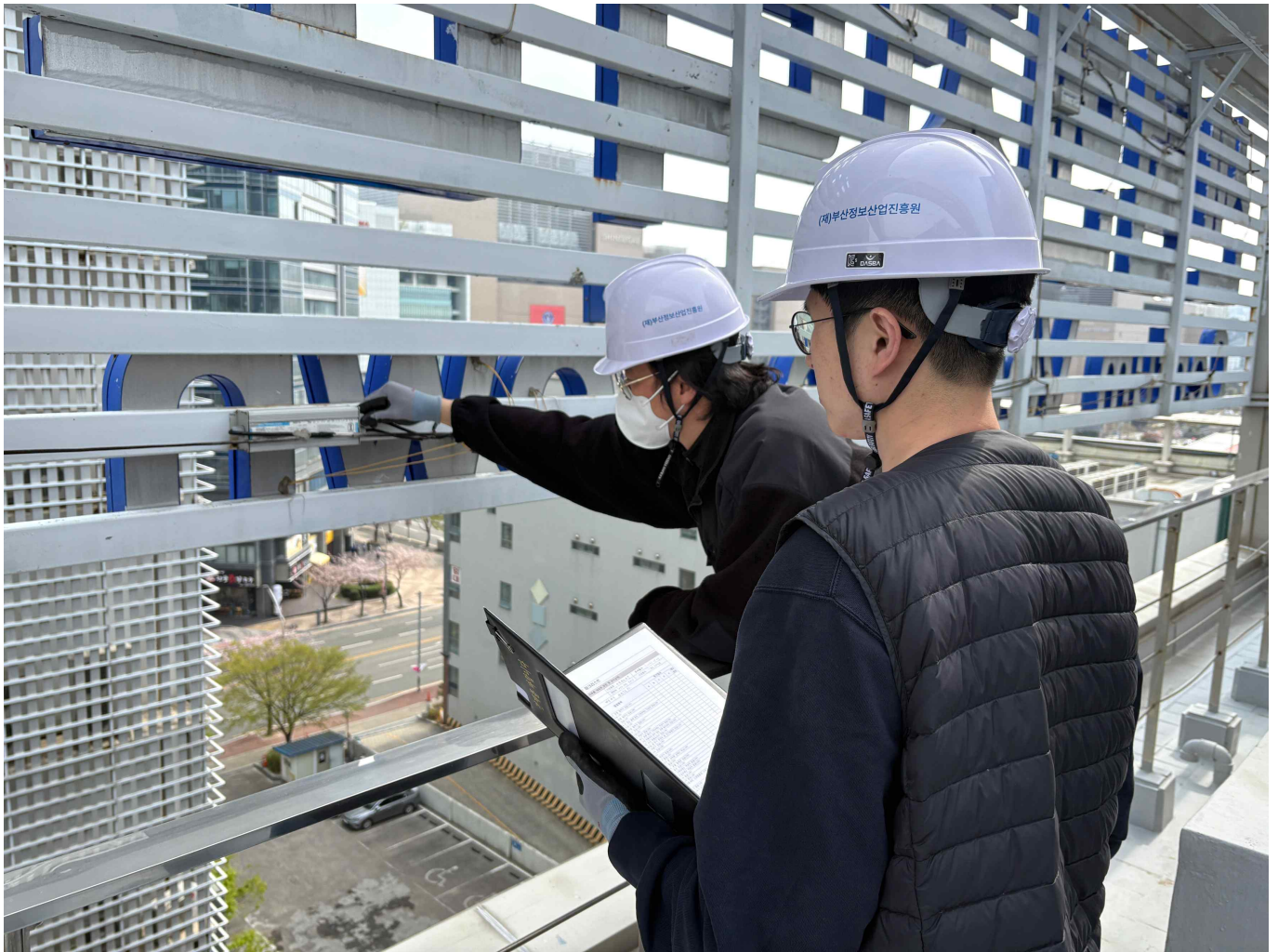
(사진설명) 센텀벤처타운 시설관리직원들이 옥외 광고물 부착상태를 점검하고 있다.