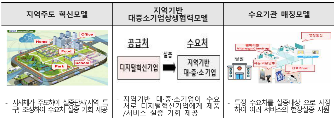
< 수요처 실증 모델 >