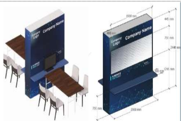
기업별 상담부스 조감도