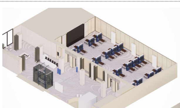
(예시) 전체 전시·체험 행사장 조감도