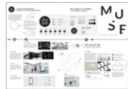
은상_IBDA Silver MUSE - Experience, Music, Perception (음악의지각)_Poon Michelle