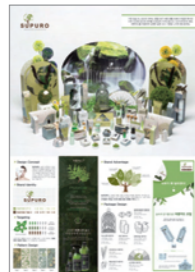
금상_IBDA Gold 피부에 자연을, SUPURO_김수민