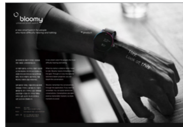
대상_IBDA Grand bloomly universal smart watch_이진원