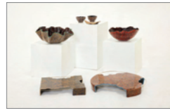
은상_IBDA Bronze 다례(茶禮)_김유