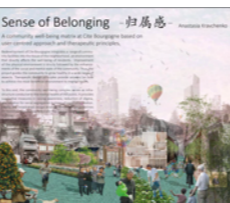
IBDA Idea_Anastasia Kravchenko