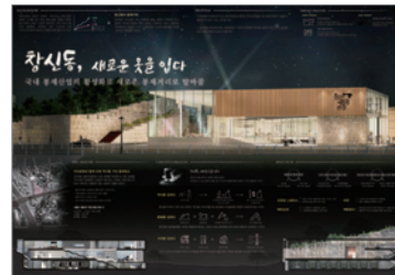
동상_IBDA Bronze 창신동, 새로운 옷을 입다_김수영