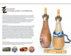
IBDA Idea_Chen Xiang-Yun