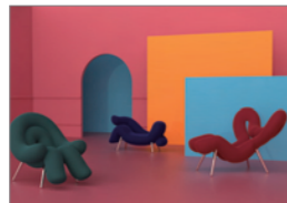
금상_IBDA Gold O.t.w_신우철