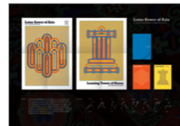
은상_IBDA Silver Lotus flower of Asia_한주연