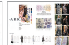
동상_IBDA Bronze ARKA_Trisha Nadira