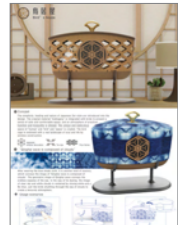
IBDA Idea_Hsu, Fang-Ping