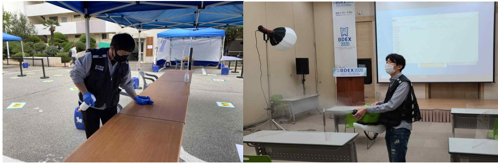
실내 소독 예시