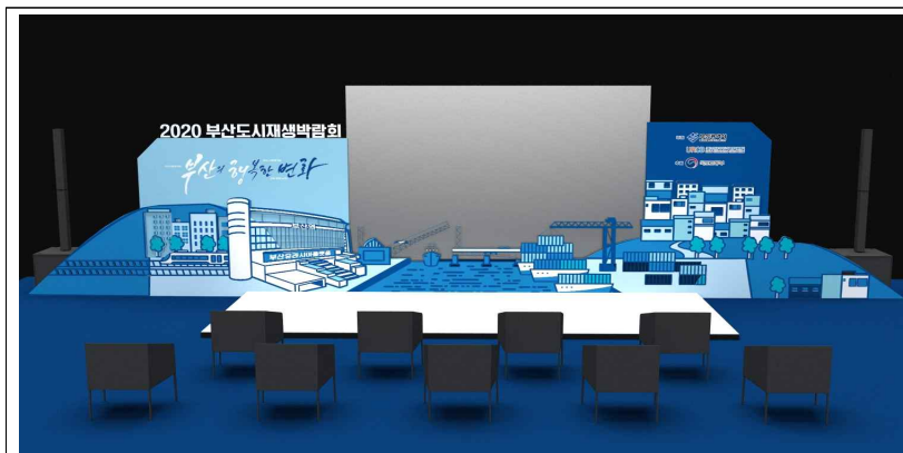
[무대 셋트 시안]