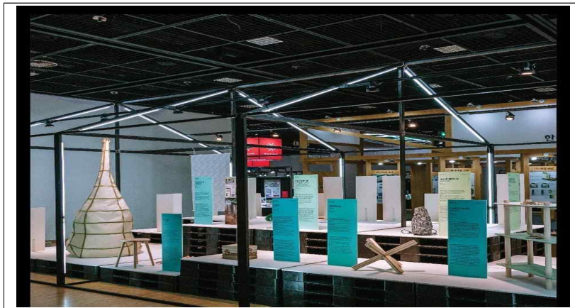
[부산도시재생 로드 예시안]