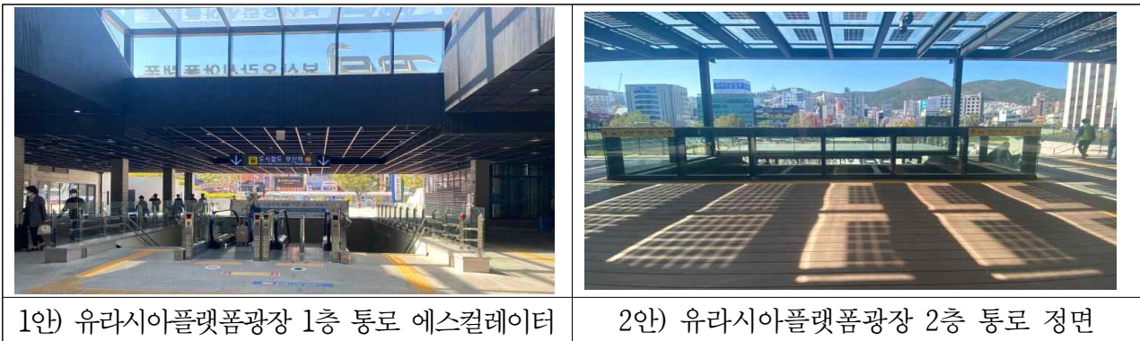
1안) 유라시아플랫폼광장 1층 통로 에스컬레이터