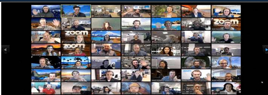
ZOOM 참가자 퍼포먼스