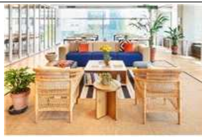
커뮤니티 라운지 및 업무공간