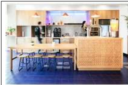
위워크 풀 서비스 팬트리