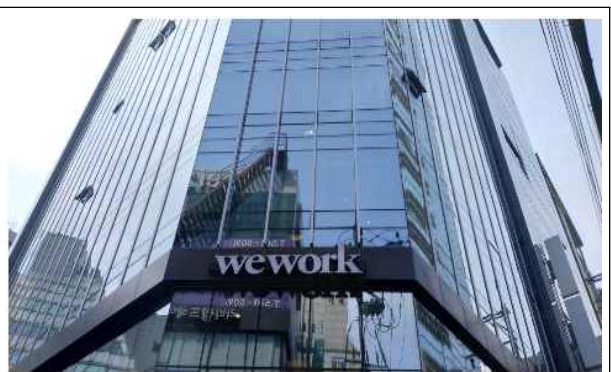
역삼2호점(서울시 강남구 테헤란로 26길 14) 10층