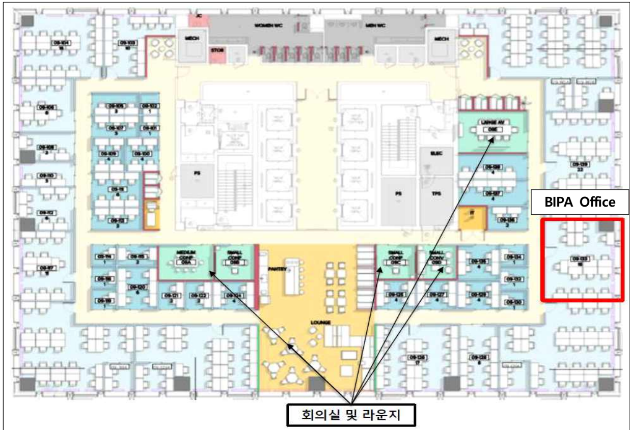
WeWork 을지로점 9층 15인 창측 오피스 (편의시설 : 5개 공용회의실, 폰부스 및 라운지 등)